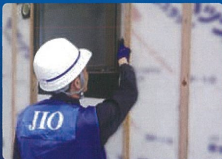
外装下地の完了時