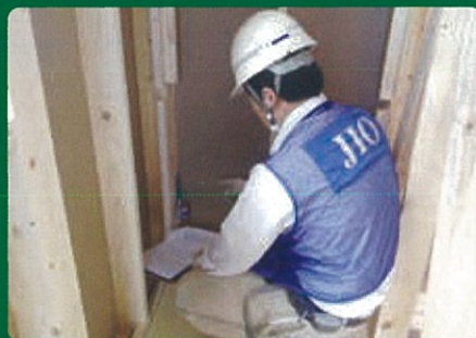
躯体工事の完了時