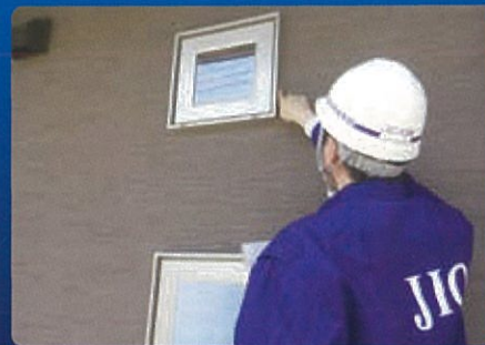
建物本体工事完了時